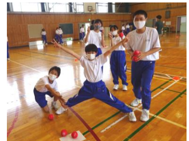
ポッチャを楽しむ1年生

これは、1年生の生活記録からの抜粋です。本校は三穂、川路、龍江の3小学校から入学してきますが、いずれも単級で保育園以来ほとんど変わらない学級集団の中成長してきました。そのため、新しく大きな集団となる中学校では新たな人間関係を構築することに、とまどいや不安、苦手意識を感じる生徒が少なからず見られます。そこで本校ではレクレーションやスポーツを通してお互いを理解し、よりよい人間関係をつくることを目的に、人間関係づくりに特化した活動を年に数回位置づけております。その活動の一環として、2年生は先月タグラグビーを、そして1・3年生は先日ポッチャを行いました。